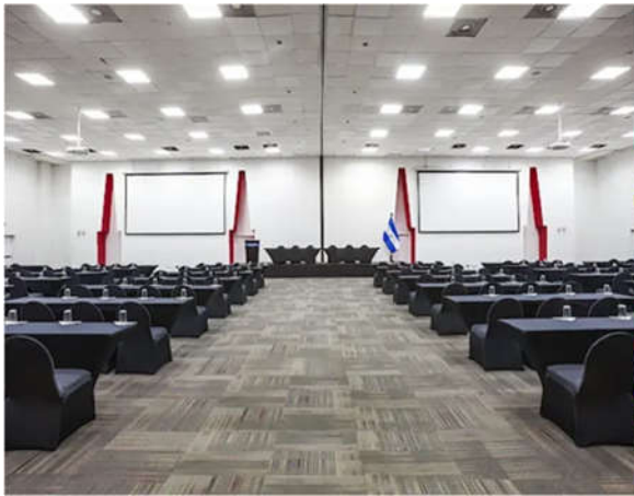
Área de juego