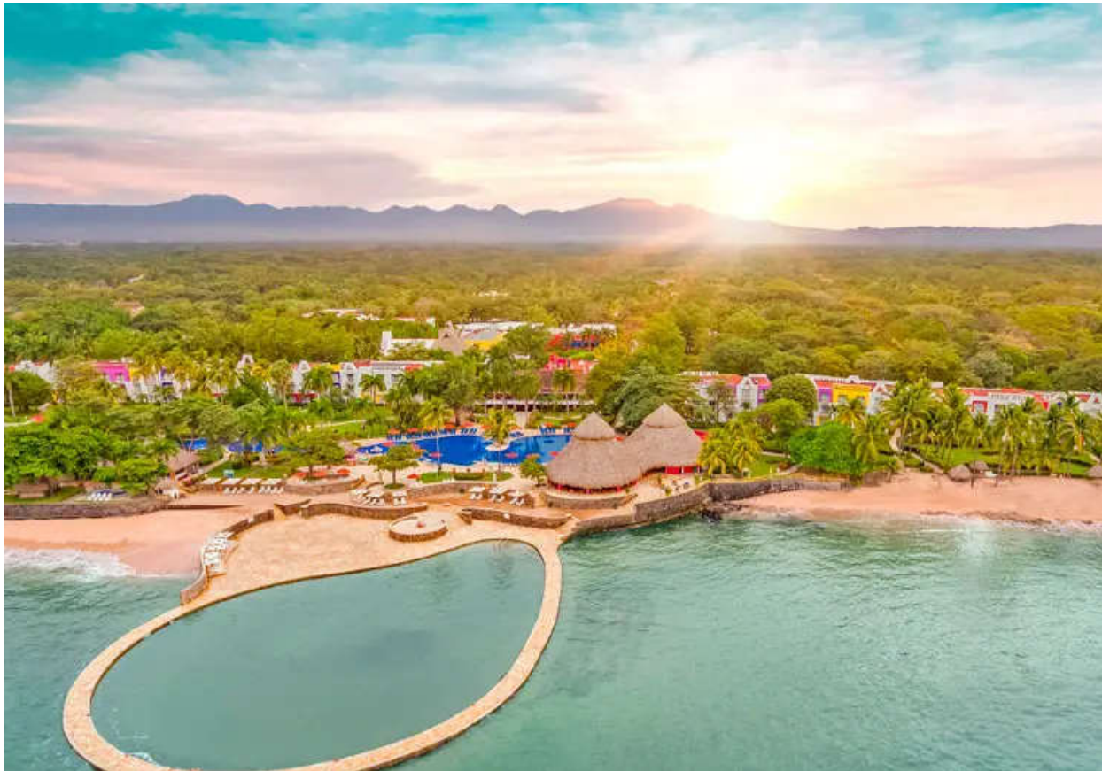
Imagen 1: Sonsonate

La Confederación de Ajedrez de América, CCA, y la Federación Salvadoreña de Ajedrez, FSA, invitan al Campeonato Panamericano de Ajedrez 2026 a todas las Federaciones Nacionales del Continente Americano al XV Campeonato a desarrollarse en la Ciudad de Sonsonate, El Salvador.